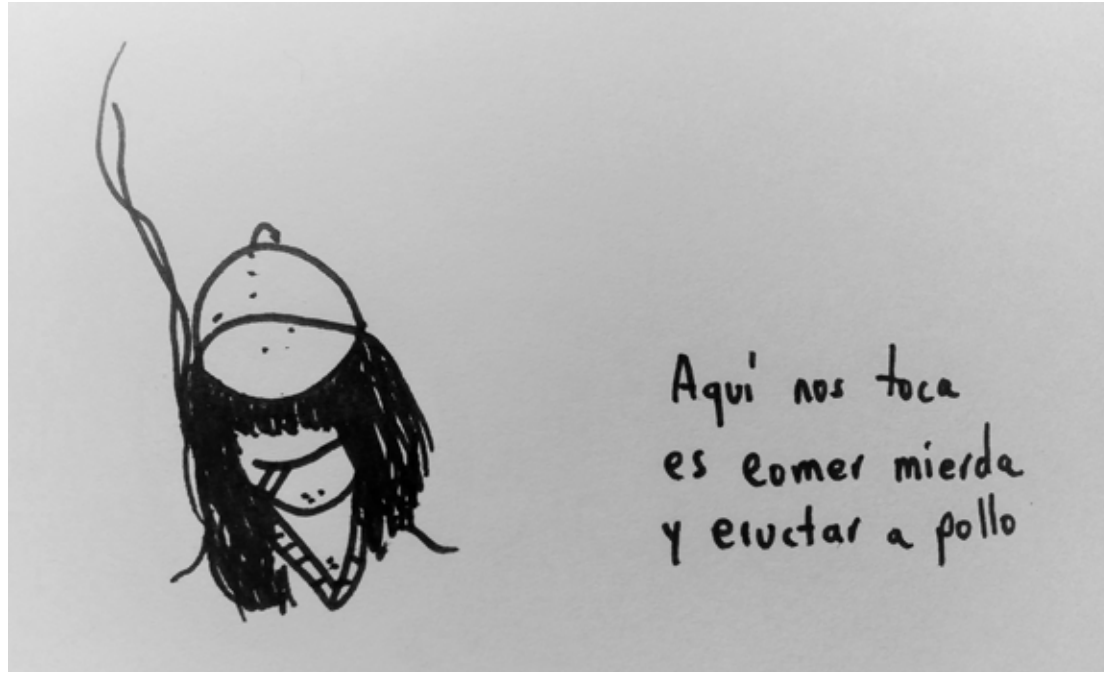
Por Gabriel Mejía